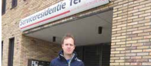
Ter Zee wordt commercieel project p. 2