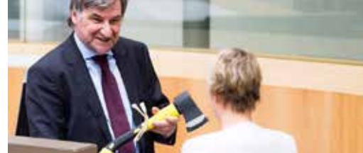
Waardevolste bossen ter discussie p. 3