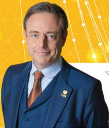
Bart De Wever Algemeen voorzitter

Engie passeert tweemaal langs de kassa. Door het uitstelgedrag van paars-groen kan het energiebedrijf extra veel geld vragen om de kerncentrales te verlengen. En daarbovenop ontvangt Engie van de regering ook nog eens gassubsidies. De belastingbetaler betaalt het gelag.