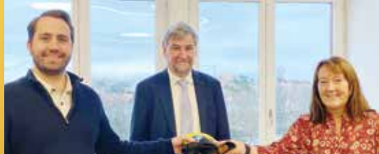
Schepenvissel in De Haan (p. 2)