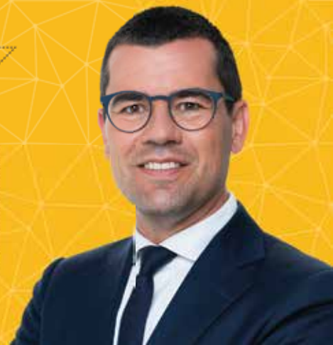
Sander Loones Kamerlid

“De N-VA blijft kiezen voor een betaalbaar, betrouwbaar en duurzaam energiebeleid. Dat maakt ons onafhankelijk van schurkenregimes. ”