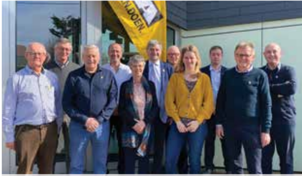
▲ De nieuwe bestuursploeg van N-VA De Haan-Wenduine