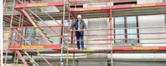
Restauratie gemeentehuis gestart (p. 3)