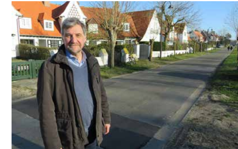
▲ Aan de erfgoedpluim is geen geldbedrag verbonden, eigenaars krijgen wel een naam bordje.

In de praktijk zal het bijna altijd gaan over beschermde monumenten, panden in een beschermd dorpsgezicht of panden op de ‘Inventaris van Bouwkundig Erfgoed’.