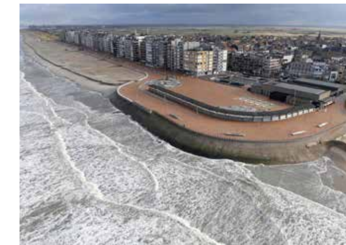
▲ In oktober gaan de werken van start.