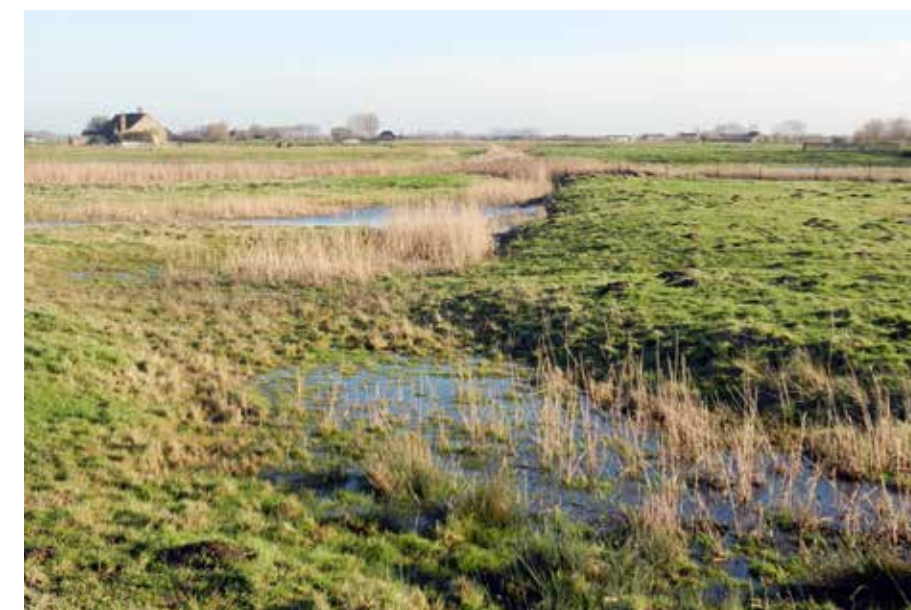
▲ De Uitkerkse Polder is nu meer dan 430 hectare groot.

Het plan heeft betrekking op grote delen van de gemeenten De Haan, Jabbeke en Oudenburg. Het bakent de natuurlijke structuur binnen het erfgoedlandschap ‘Polder Klemskerke-Vlissegem’ af. De omzetting van bepaalde historische graslanden naar natuurgebied zorgt er ook voor dat zij een cruciale rol in de waterhuishouding kunnen blijven spelen.