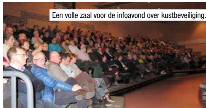
Een volle zaal voor de infoavond over kustbeveiliging.

De verzanding van de Koninklijke Baan achter de duinen zou in dat opzicht volgens haar een goede zaak zijn.