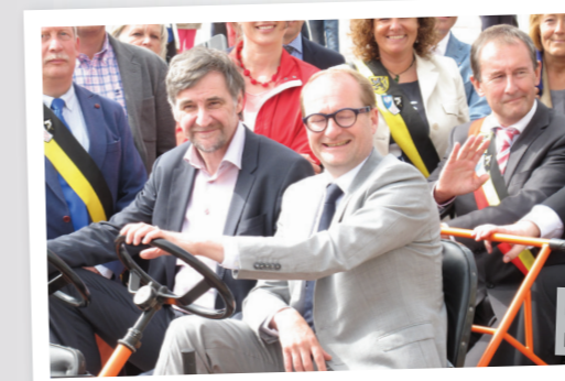
Ben Weyts en Wilfried Vandaele rijden de nieuwe dijk officieel in.

De werken werden in negen maanden voltooid. Weyts: "Voor 750 meter strekkende meter dijk waren nodig: 3000 ton staal, 4000 m 3 gewapend beton en 1,5 miljoen klinkers".